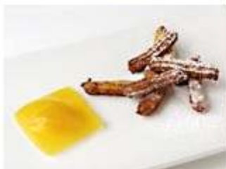
柑橘類のラヴィオールとキャラウェイ風味のチュロス Raviole d'agrumes et chourros au carvi