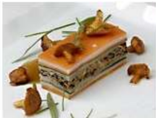
野菜のミルフィーユ Millefeuille de Legumes