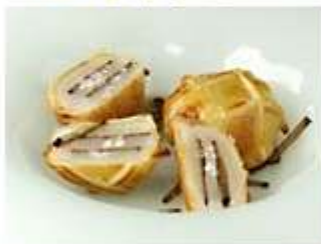
帆立のパイ皮包みと秋トリュフ Saint Jacques en Croute et Truffes d'automne